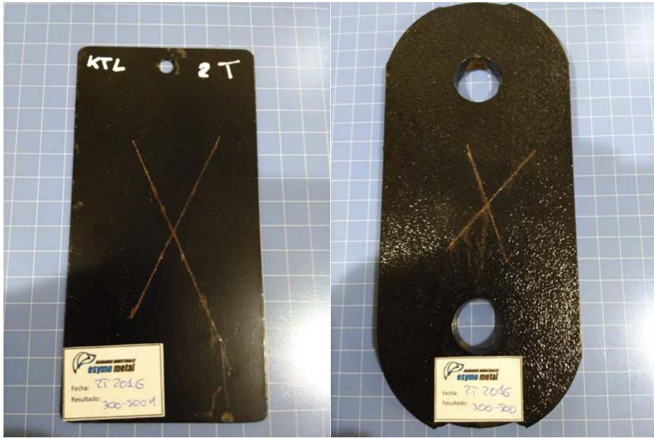
Cataforesis 300 - 500 h