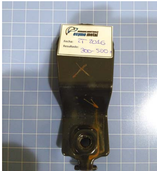
Pintura en Polvo 300 - 500 h