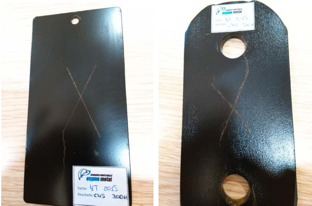
Cataforesis 300 - 500 h